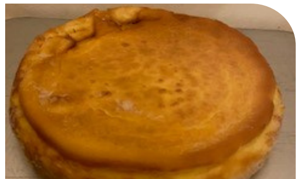
バイクドチーズケーキ