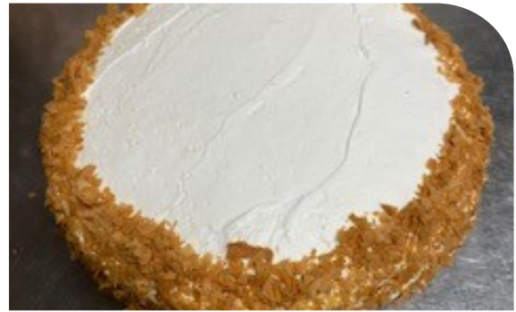
カスタード付きアーモンドタルト

基本のタルト生地。クリームやカスタード、フルーツなどを載せて簡単にオリジナルタルトに タルト生地1600円