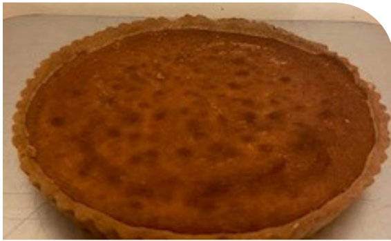
タルトダイヤモンド（アーモンドタルト）

基本のタルト生地。クリームやカスタード、フルーツなどを載せて簡単にオリジナルタルトに タルト生地1600円