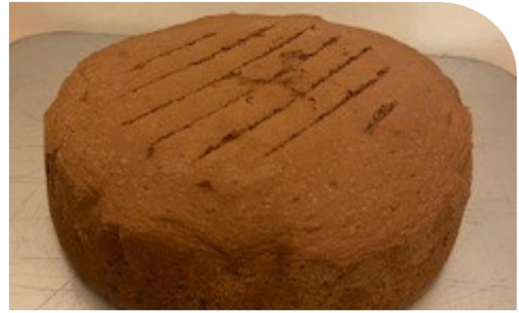
ジェノワーズショコラ