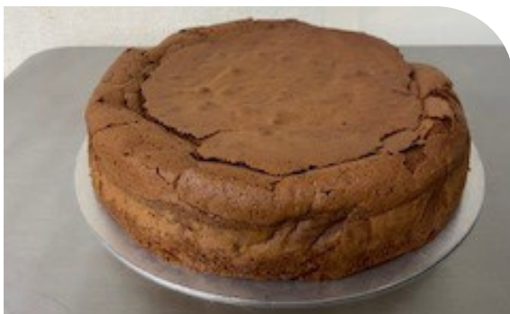
クラシックショコラ

フルーツを載せるだけでフルーツタルトが完成するカスタード・クリーム付のタルト生地 カスタード付き2000円