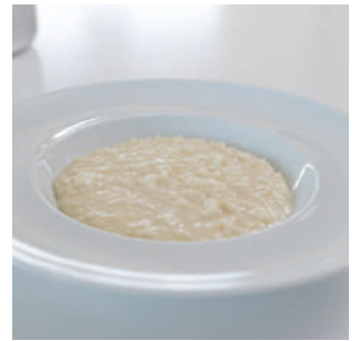
名物★パルミジャーノチーズリゾット