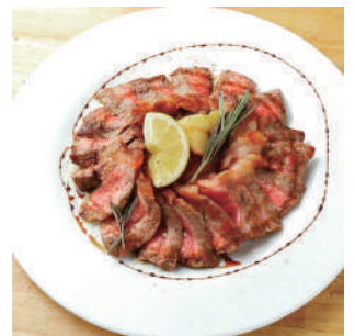
サーロインステーキ 400g