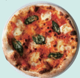
マルゲリータピザ