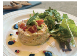
マグロとアボカドのタルタル