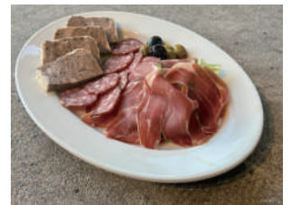
お肉屋さんの前菜盛り合わせ