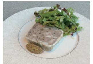
パテ・ド・カンパーニュ