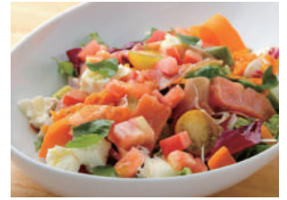
人気 NO.1 ! タクカフェサラダ