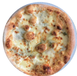
クアトロ・フォルマッジョ