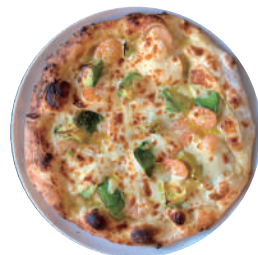
小海老とアボカドのマヨピザ