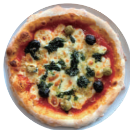
しらすとオリーブと生海苔のピザ